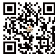
征兵体检常见不合格问题恢复训练和建议