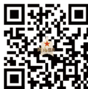
《应征公民体格检查标准》摘要